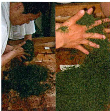
●揉み切り (茶そろえ)