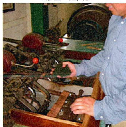
●精揉機 (後半) ※重量微調整・遅回転