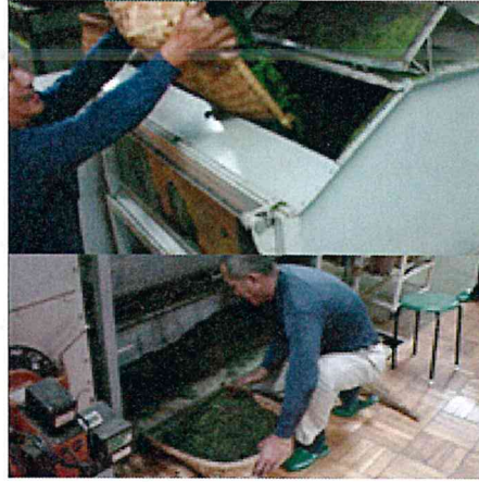
●粗揉機（第一・第二）