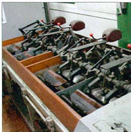
●精揉機 (さばき揉み)